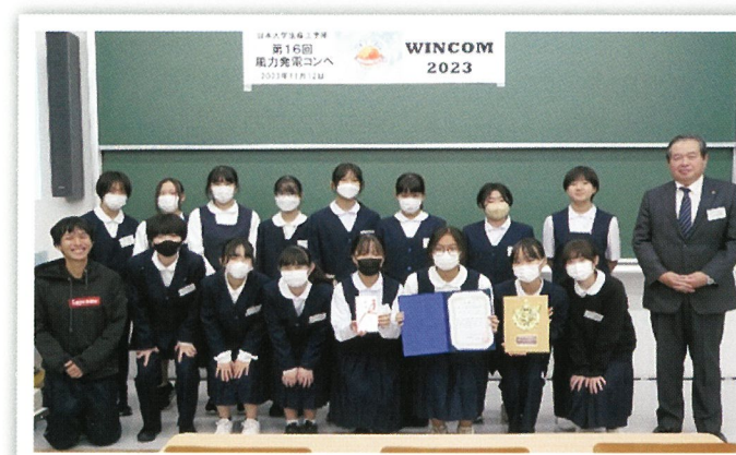
校友会賞受賞 蕨市立第一中学校【女子卓球部】チームの「SBNUS」