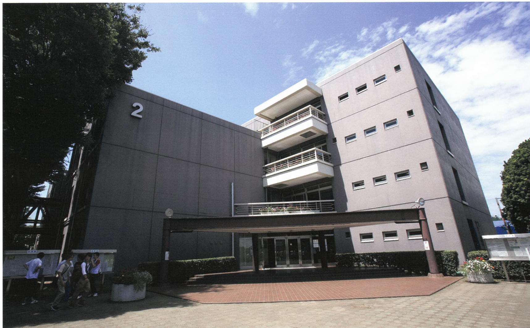
教室棟I 昭和56年度竣工