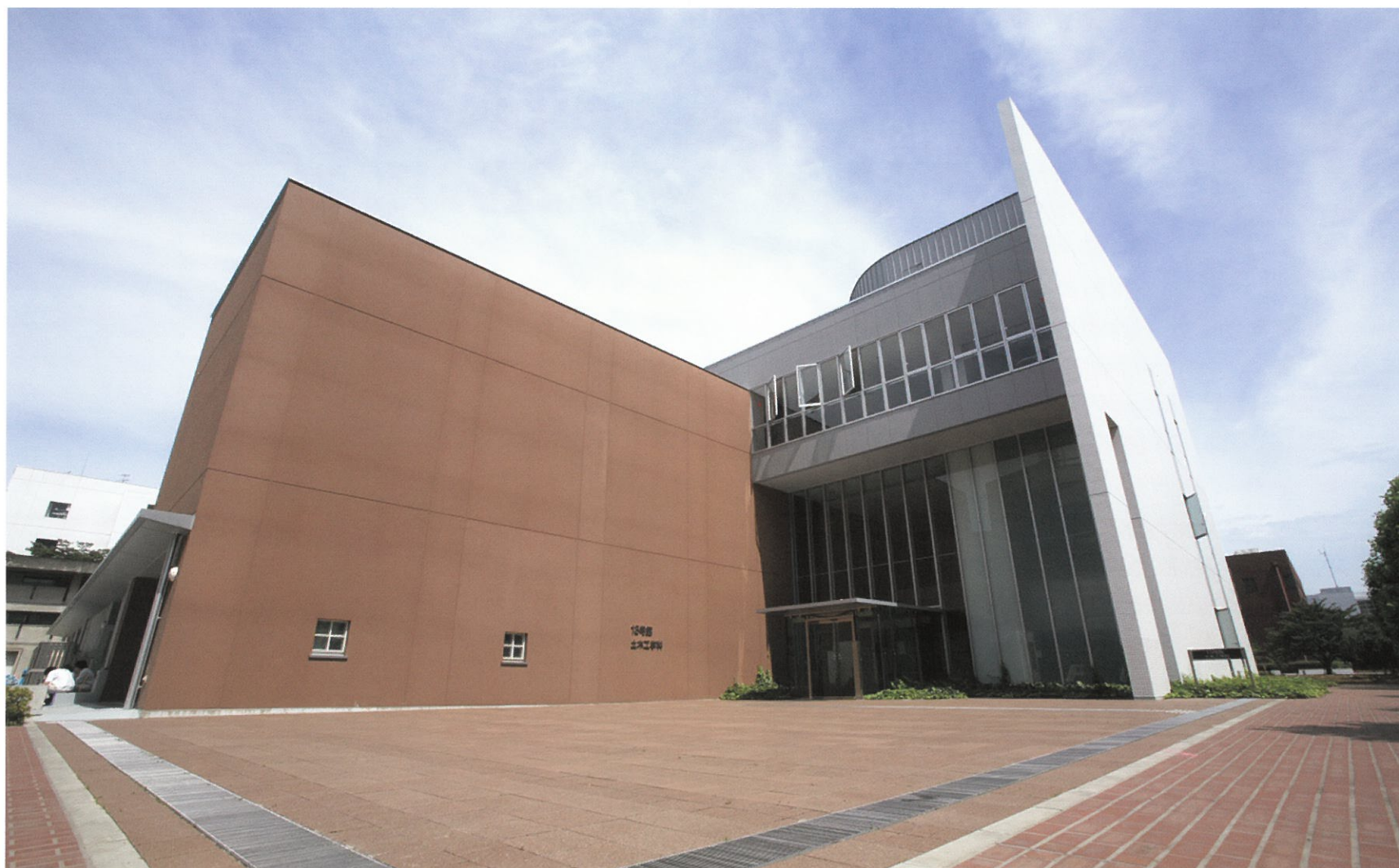
13号館 土木工学科 平成19年度竣工