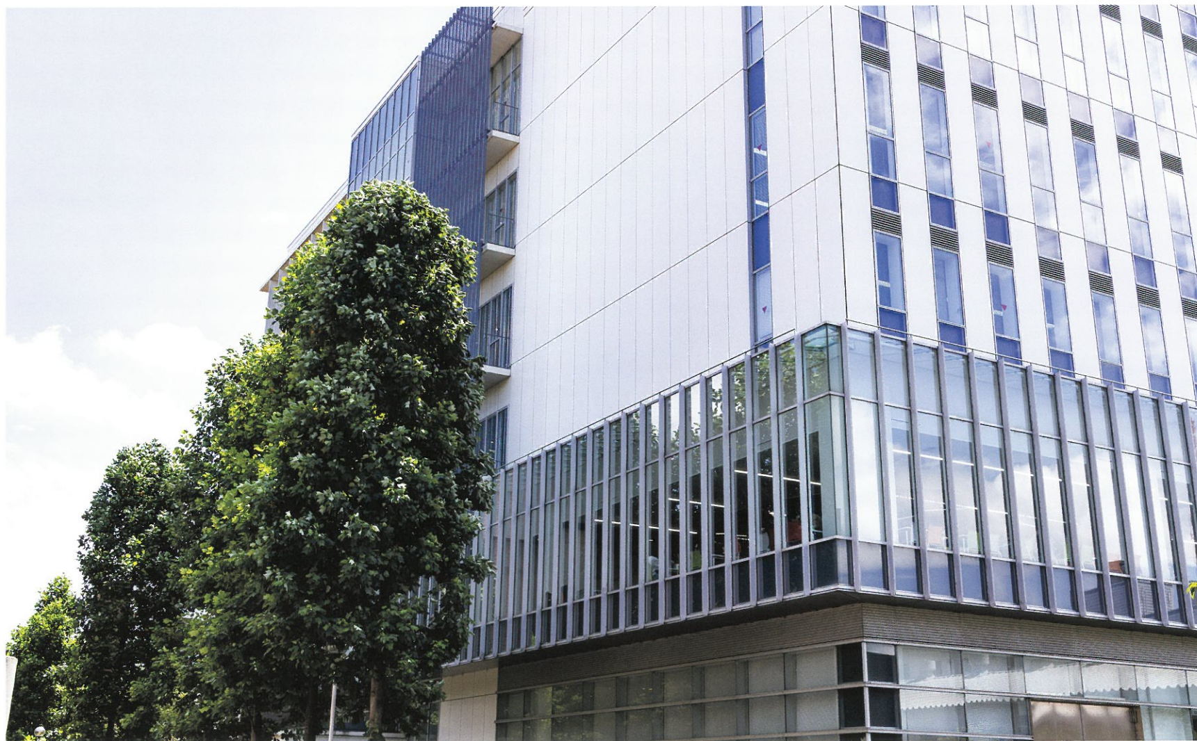
39号館 生産工学部60周年記念棟 平成23年度竣工