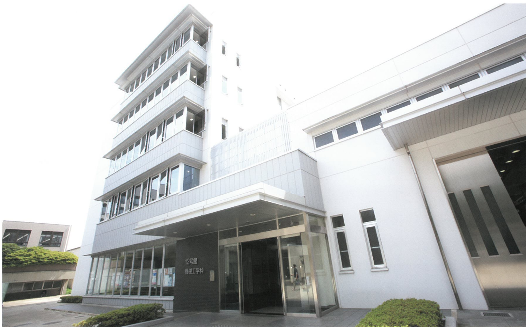
12号館 機械工学科 平成17年度竣工