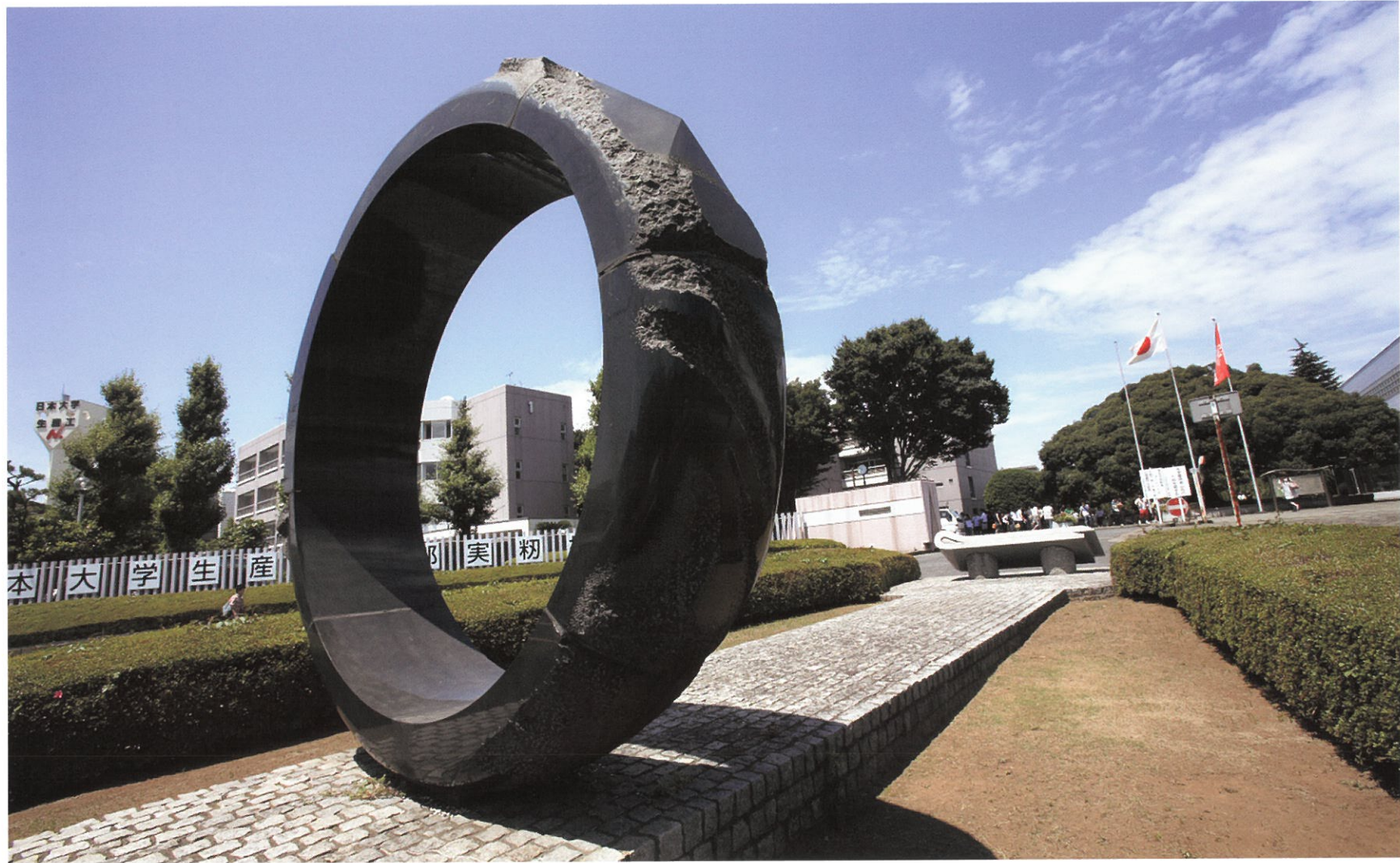
「風景の指環」 関根仲夫 作