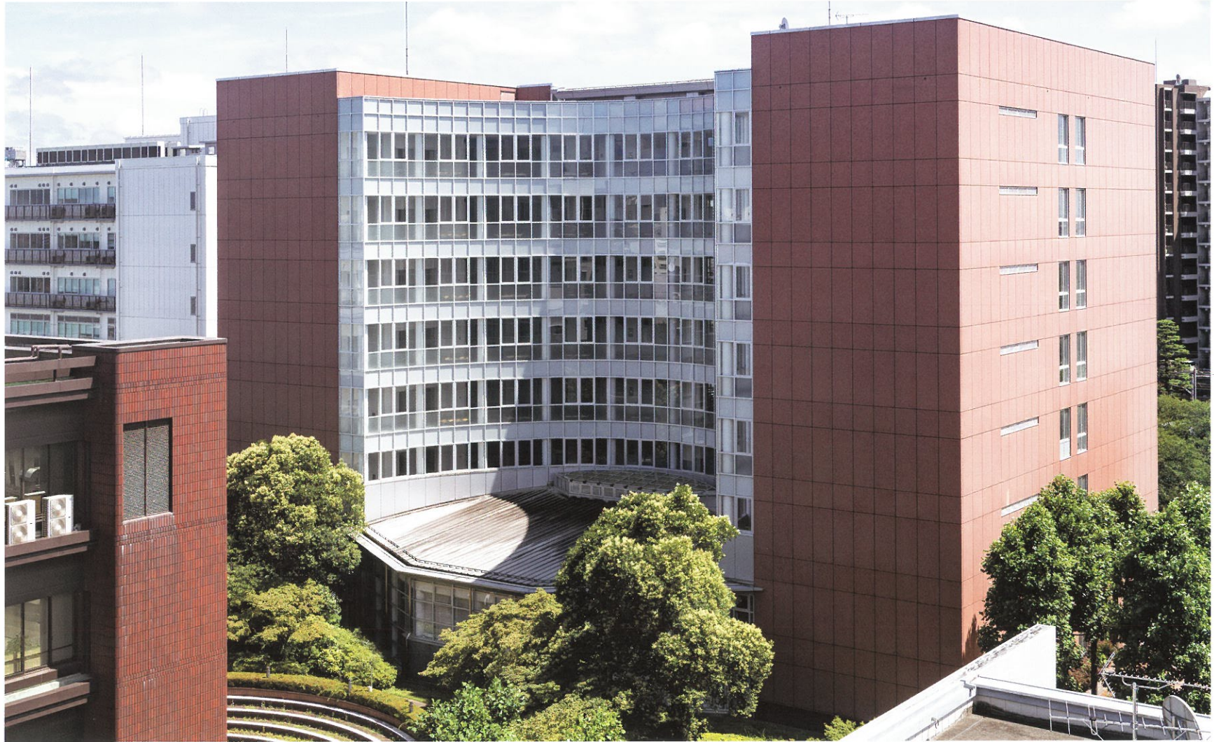
37号館 教室棟 平成15年度竣工