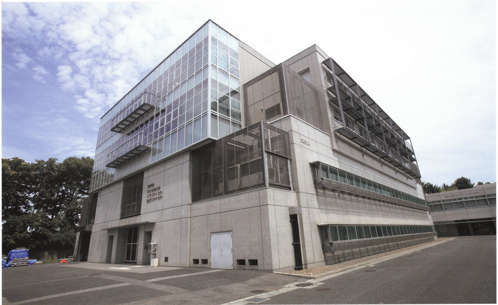
32号館 平成12年度竣工