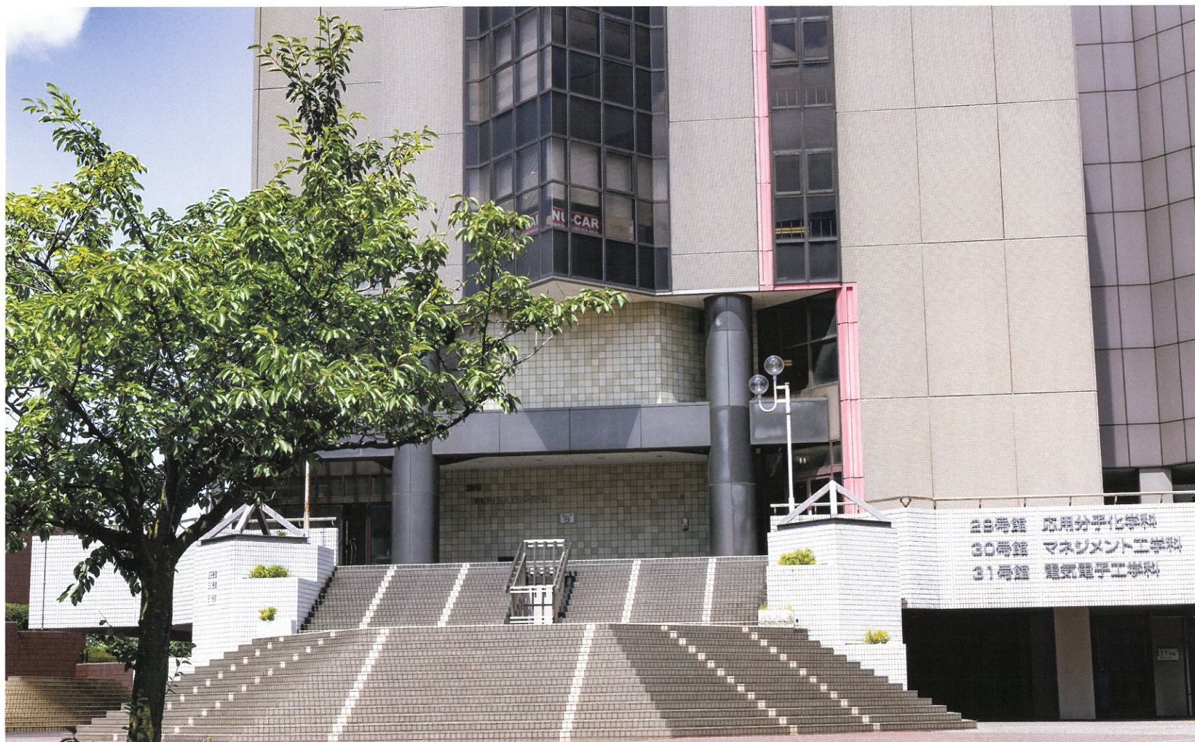
100周年記念講堂 平成4年度竣工