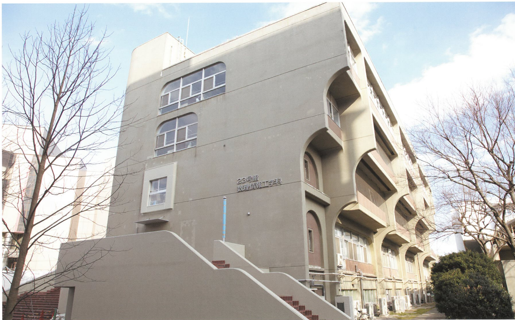
23号館 数理情報工学科 昭和51年度竣工