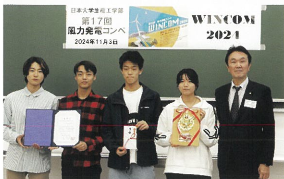
校友会賞チームの風車