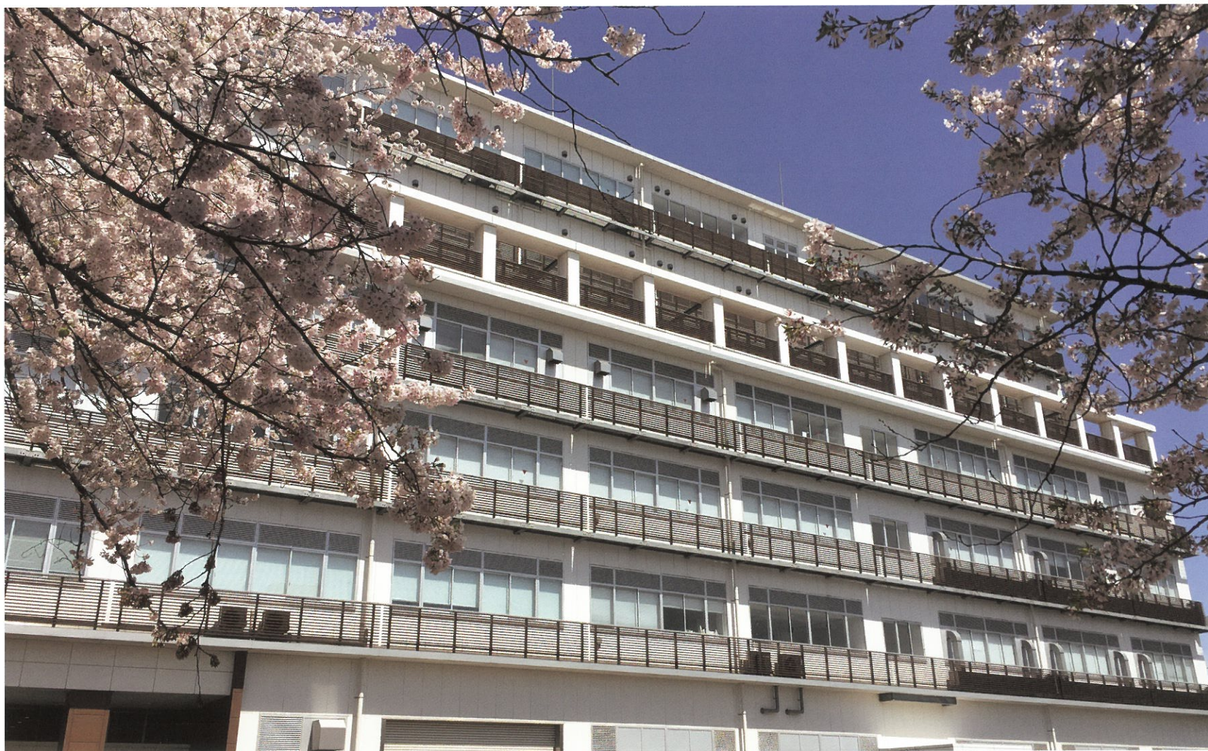
40号館 生産工学部60周年記念棟 平成24年度竣工