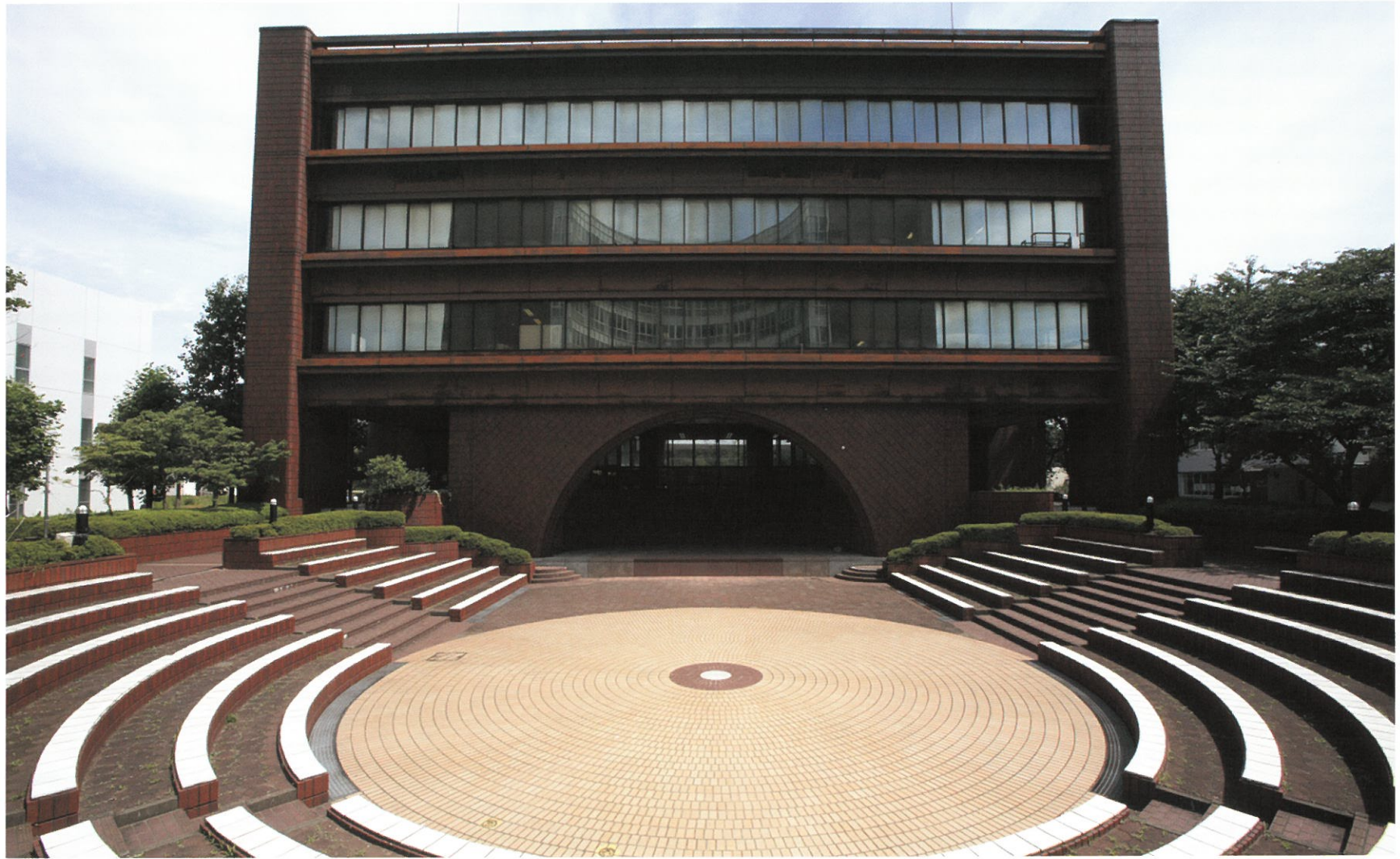
24号館 研究センター 昭和59年度竣工