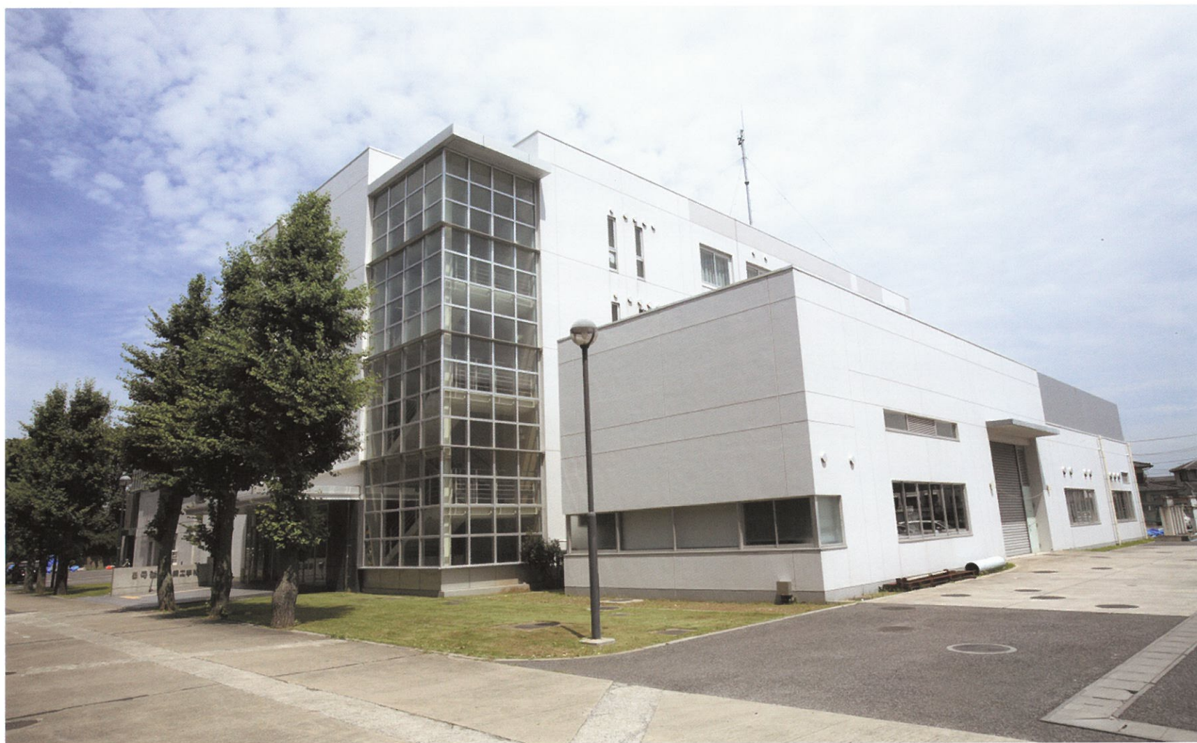
5号館 建築工学科 平成16年度竣工