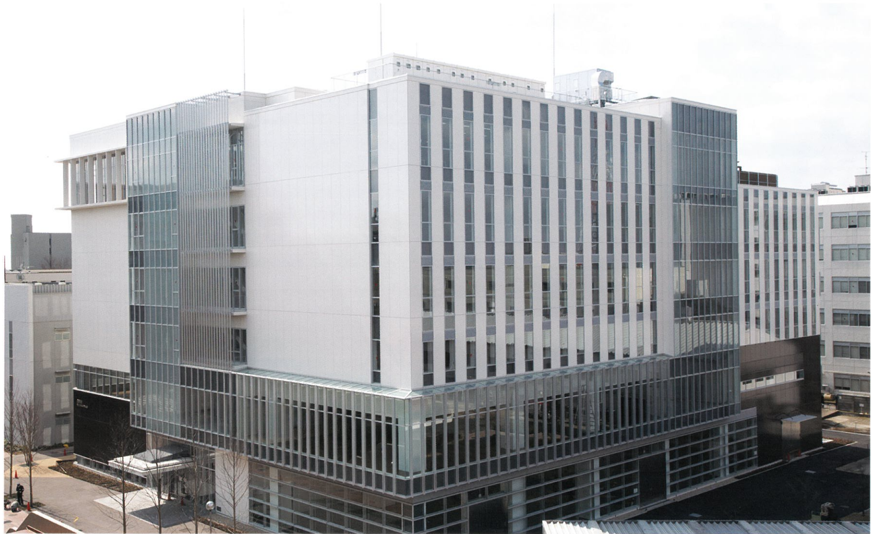
39号館 生産工学部60周年記念棟 平成23年度竣工