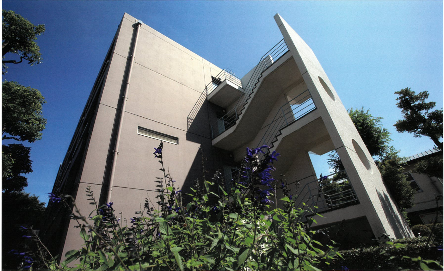
研究棟 昭和56年度竣工