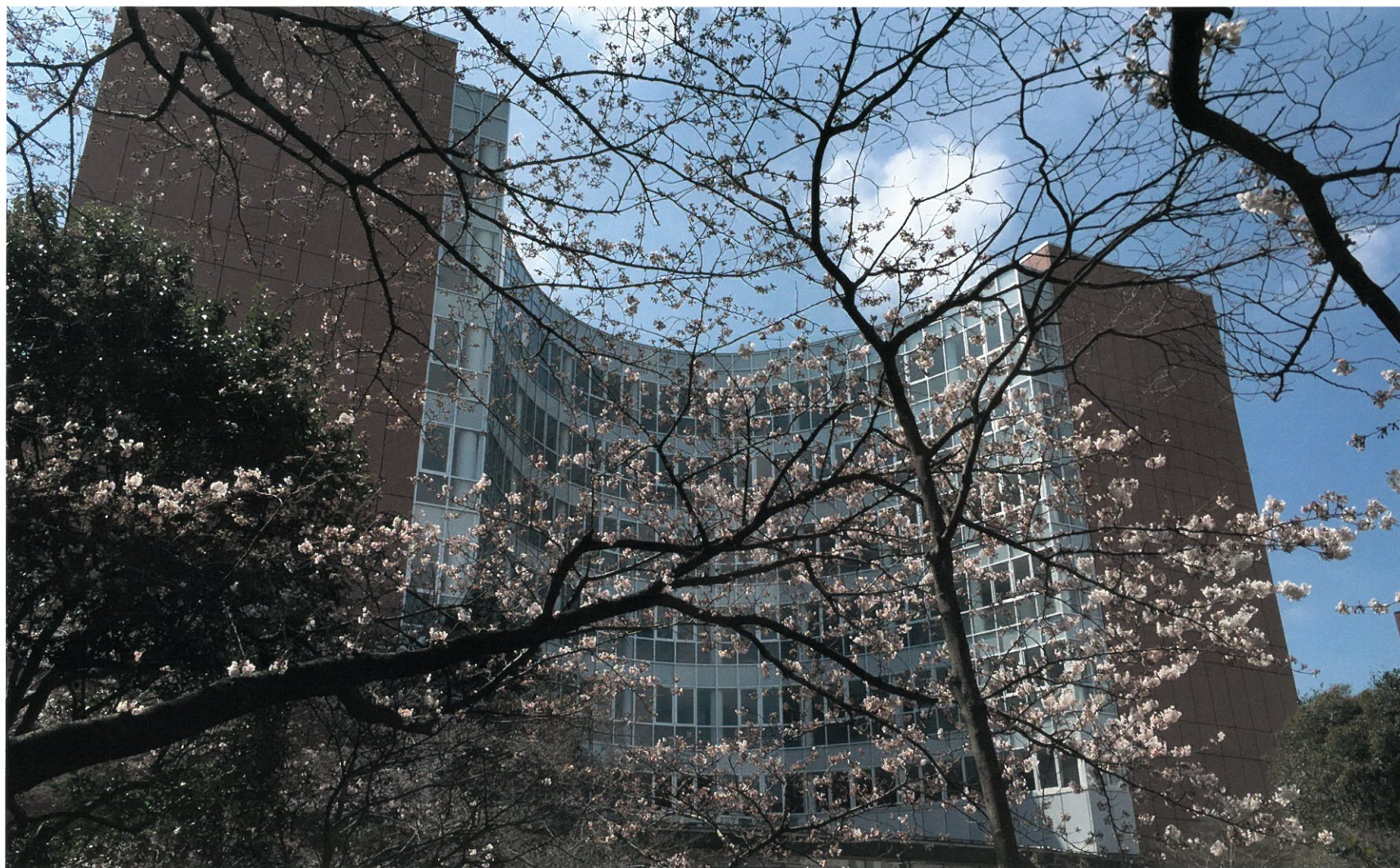
37号館 教室棟 平成15年度竣工