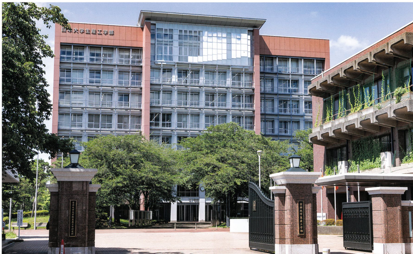
37号館 教室棟 平成15年度竣工