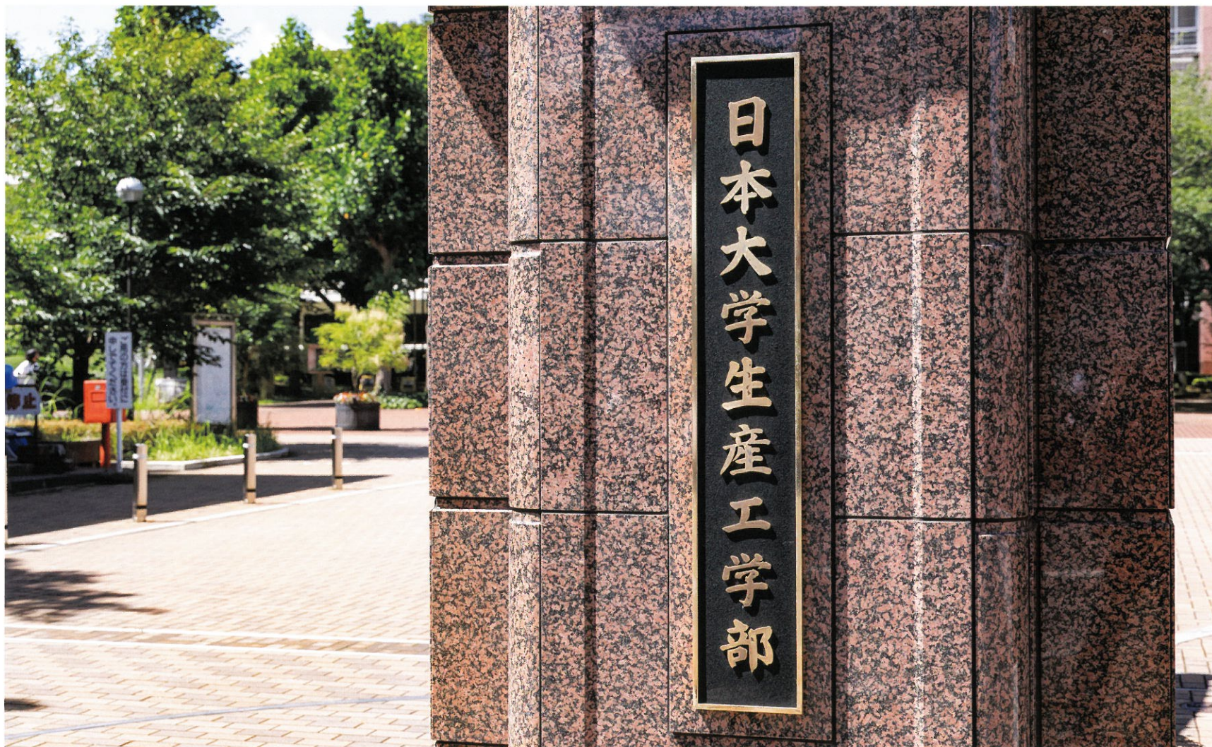
日本大学生産工学部 正門