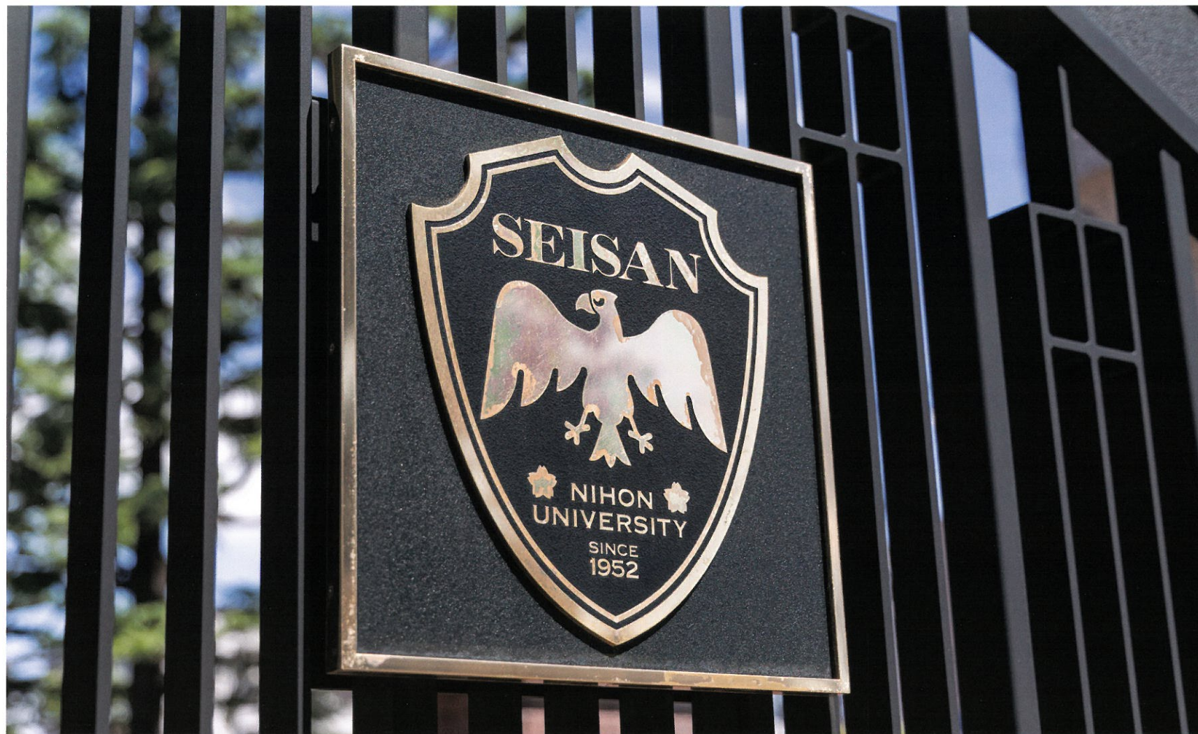
日本大学生産工学部 エンブレム