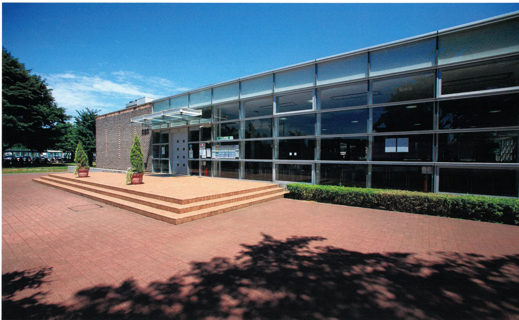
食堂棟Ⅱ 平成12年度竣工