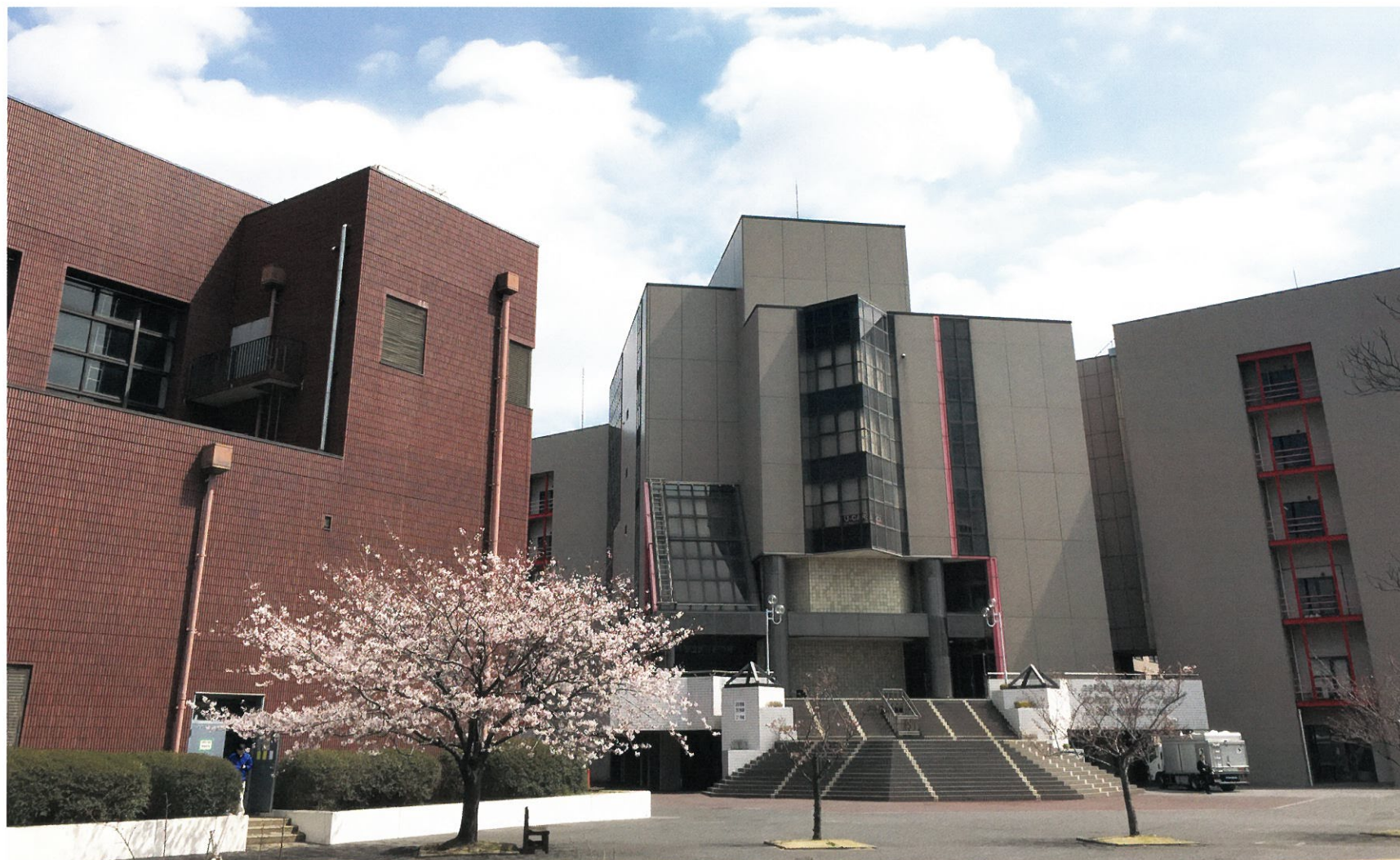
100周年記念講堂 平成4年度竣工