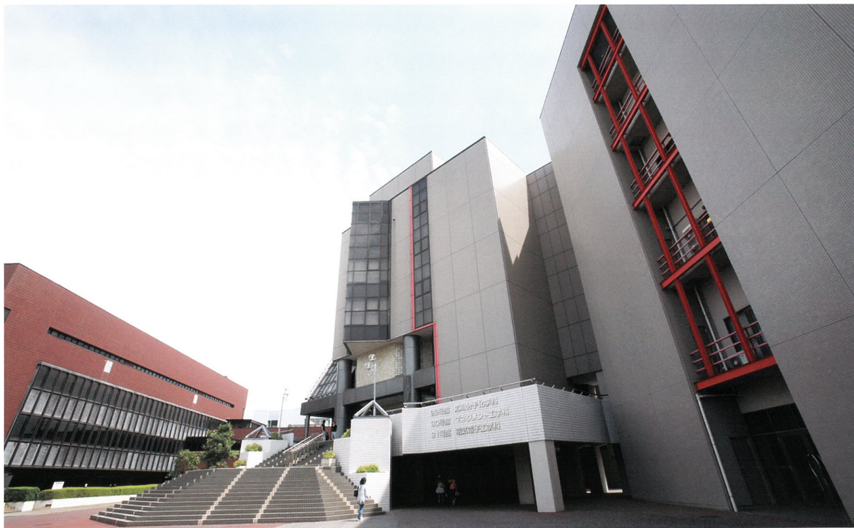
100周年記念講堂 平成4年度竣工