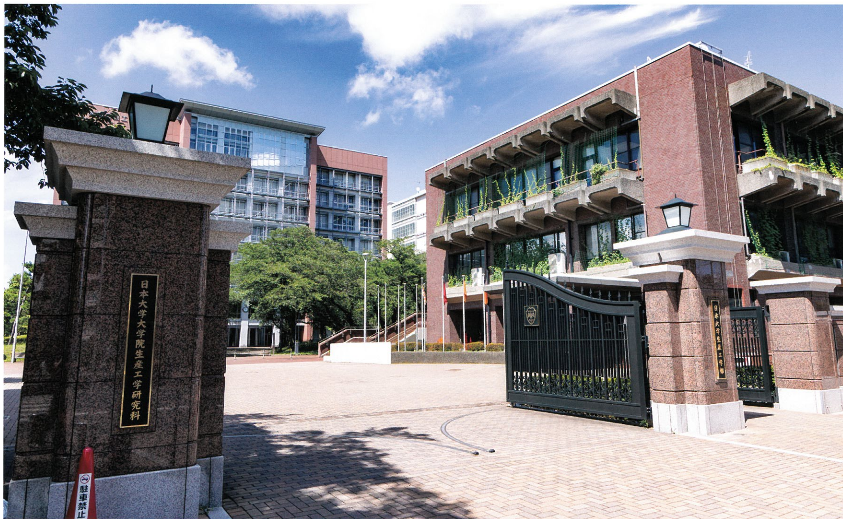
日本大学生産工学部 正門