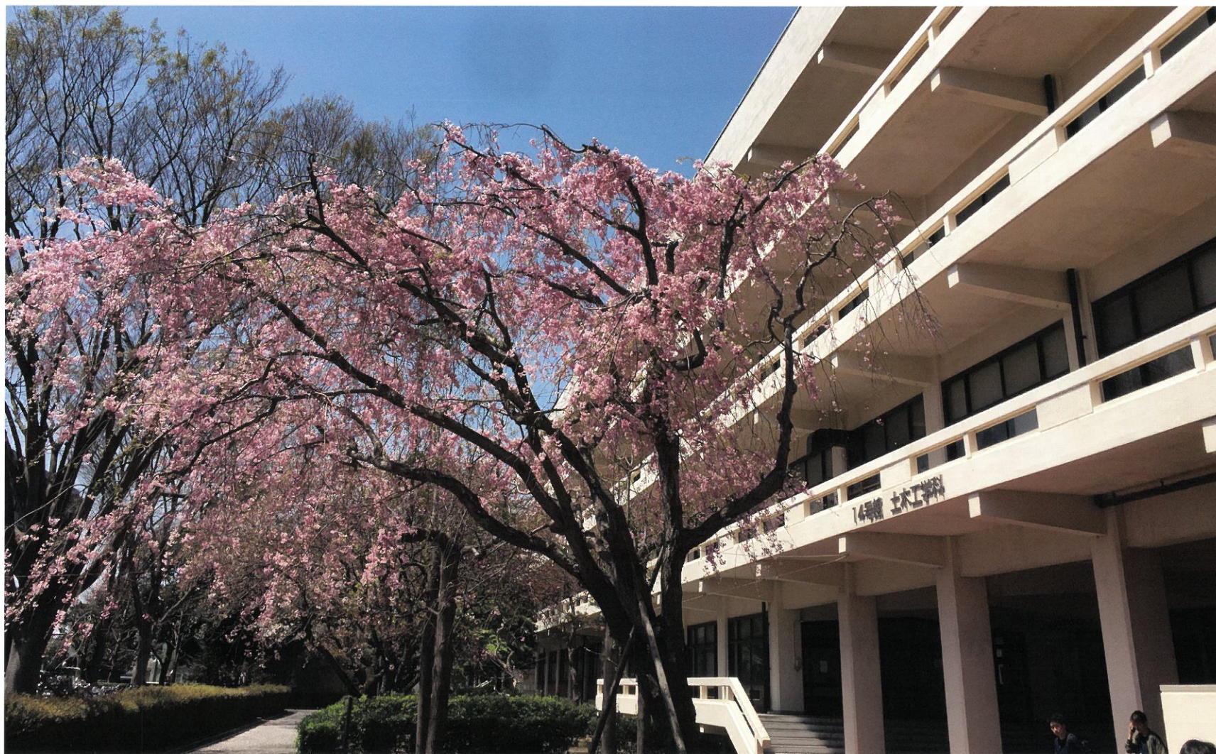
14号館 土木工学科 昭和35年度竣工